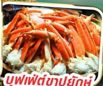
บุฟเฟ่ต์ขาปูยักษ์