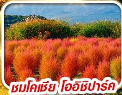
ชมโคเชีย โออิชิปาร์ค