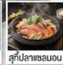
สุกี้ปลาแซลมอน