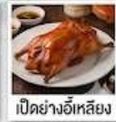
เป็ดย่างอีเหลียง