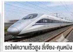
รถไฟความเร็วสูง ลี่เจียง-คุนหมิง