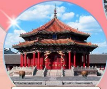
พระราชวังกุ๋ก เลิ่นหยาง