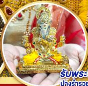
รับพระพิฆเนศวร ปางรำรอย ท่านละ 1 องค์